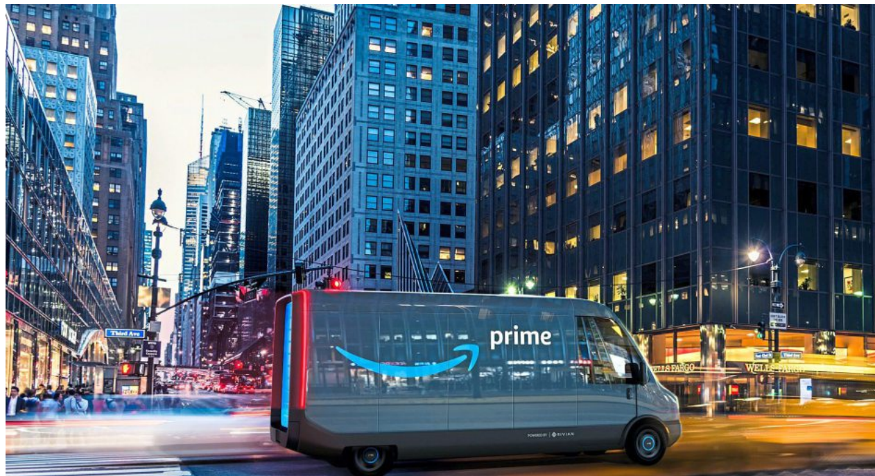
Letzte Meile: Durch ihre hohen Bestellvolumina – auch in Deutschland – müssen Prime-Kunden von Konzepten einer alternativen Zustellung überzeugt werden, wenn sie funktionieren sollen.

Ein Ergebnis aus der im September 2019 durchgeführten repräsentativen Online-Umfrage von 2017 volljährigen Bewohnern deutscher Großstädte im Rahmen dieses Forschungsprojektes war unter anderem, dass 89,3 Prozent der Befragten schon einmal bei Amazon Waren online bestellt haben.