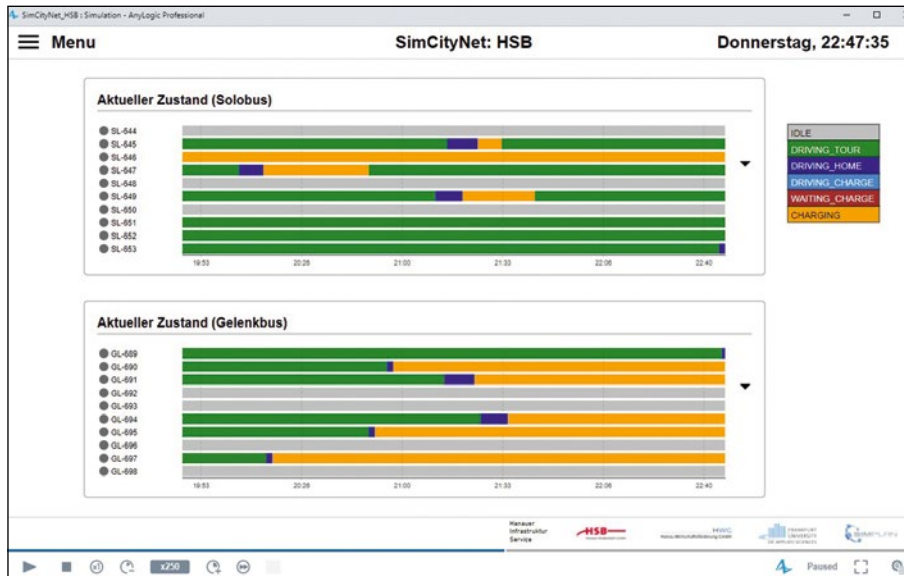
Abb. 2: Während der Simulation können Betriebsprozesse überwacht und bewertet werden. Dargestellt ist hier der aktuelle Betriebszustand der einzelnen Busse im Simulationsdurchlauf.