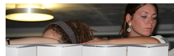
"Plan": Gesucht, die Galerie im 3.OG als Schwarzplan für eine Ausstellung mit 25 Wandelementen, Beleuchtung und Porträts.