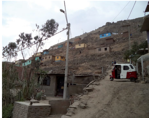
Bild 1: (links) Urbanisierung am Rande von Bogotá.