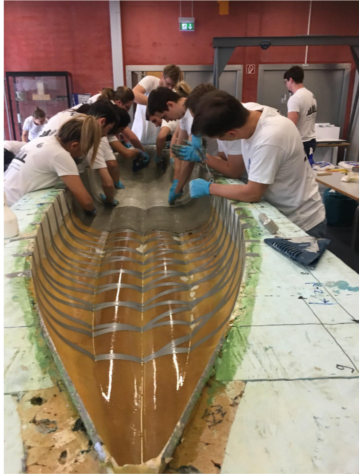
Auftrag der ersten Betonschicht mit Spachteln und Händen