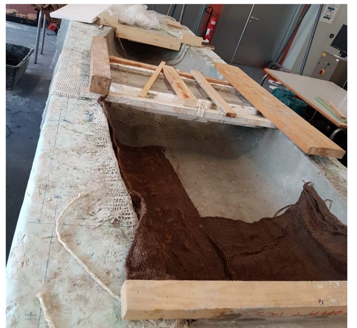
Zur Nachbehandlung wurden Jutebeutel in Wasser getränkt und auf den Beton ausgelegt.