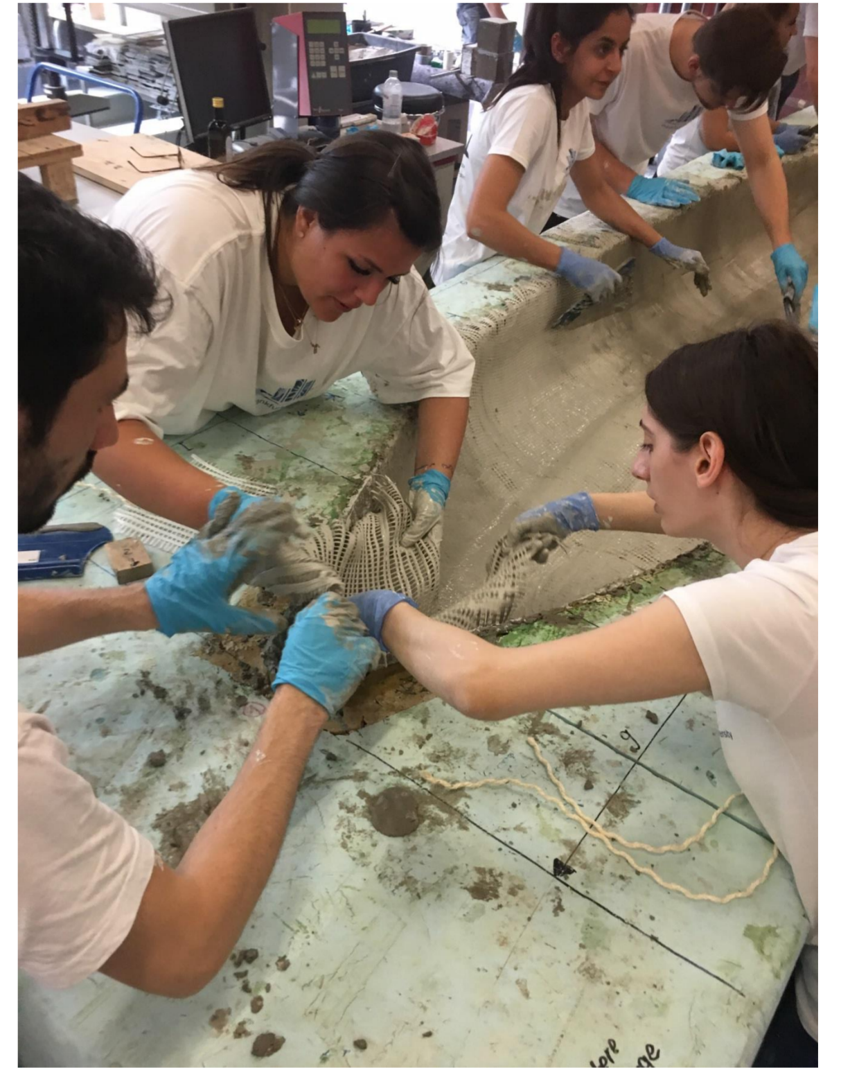
Einbau der 2-lagigen Glasfasertextilien unmittelbar nach deren Tränkung in Zement-Suspension