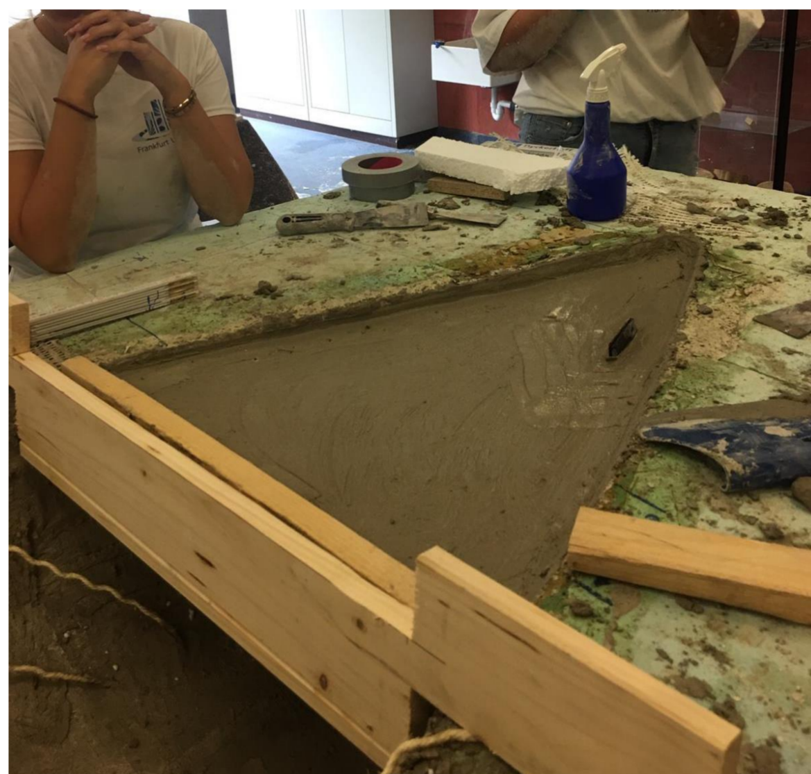
Frisch-in-frisch-Betonage der Aussteifungen an Heck, Bug und Kanumitte. Die Aussteifungen wurden mit EPS-Platten geschalt.