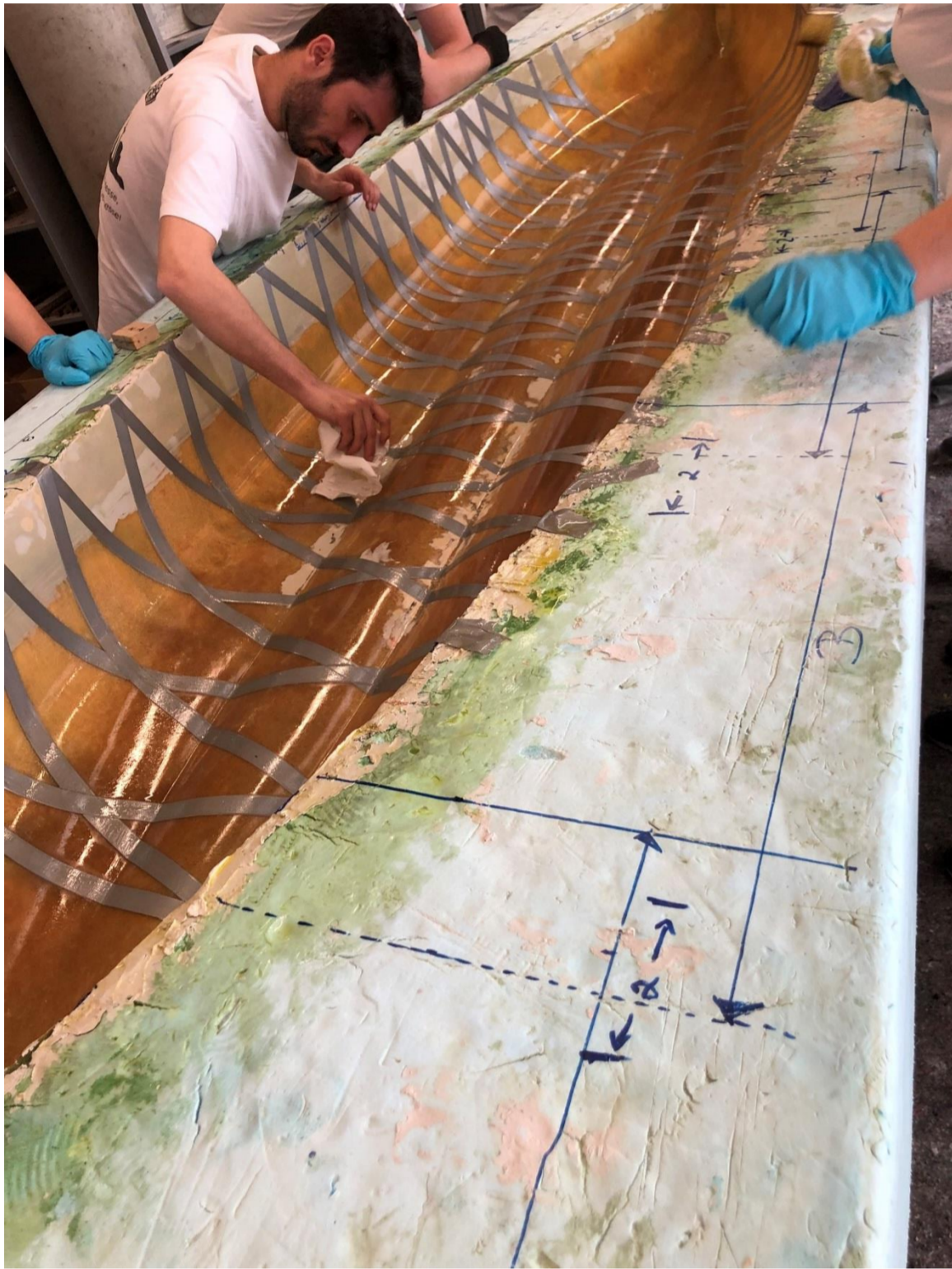
Aufbringen des Rapsöls als Trennmittel