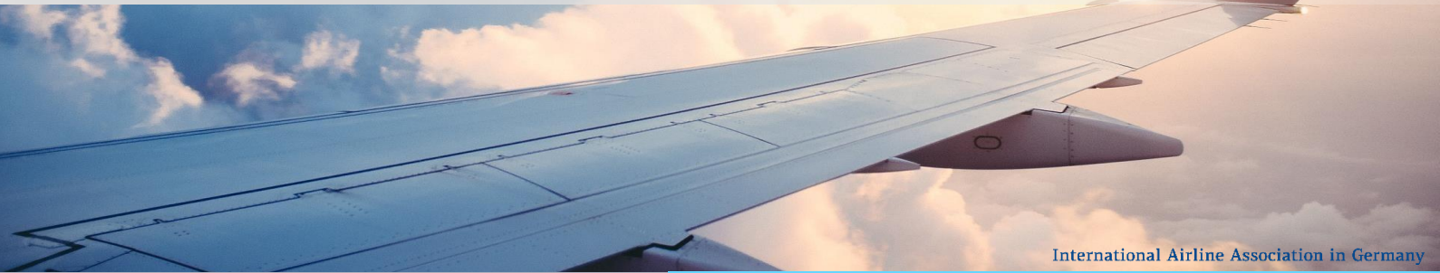
International Airline Association in Germany